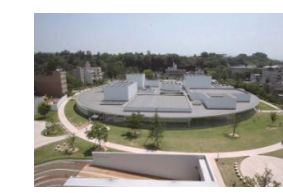
Triển lãm mỹ thuật Kanazawa thế kỉ 21