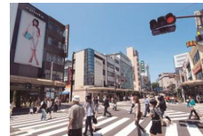
Phố mua bán

< Trang chủ thành phố Kanazawa http://www4.city.kanazawa.lg.jp/ >