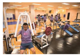
Phòng thể chất