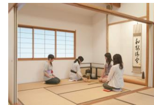
Cérémonie du thé