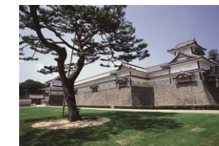
Château de Kanazawa