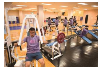
Salle de gym