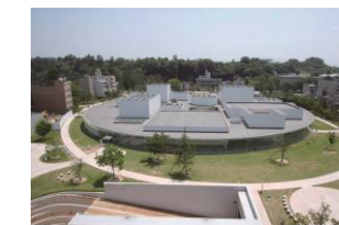
Musée d'art du 21 ème siècle