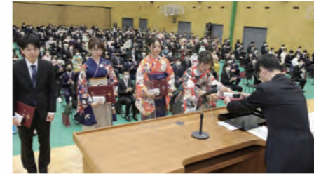
2021年度卒業証書・学位記授与式 (2022年3月15日挙行)

2021年度卒業式及び2022年度入学式は、出席者を卒業生と登壇者(学長、理事、副学長、学部長、別科長)に限定し、松雲記念講堂で挙行了しました。両式典の様子はオンラインでライブ配信しました。また、新型コロナウイルスの影響を受け、入学時期が遅れていた2021年度及び2022年度入学の留学生の皆さんが無事来日し、登学出来るようになったことを歓迎するため、留学生入学式を挙行了しました