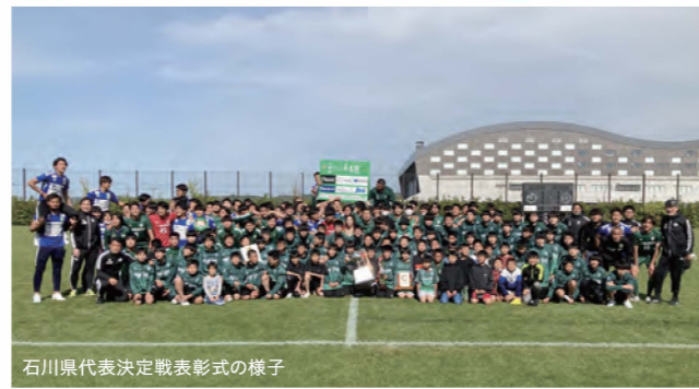
石川県代表決定戦表彰式の様子

石川県代表決定戦 対 金沢星稜大学(2-1) 天皇杯1回戦 対 松本山雅FC(2-3)