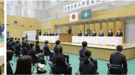
2022年度入学宣誓式 (2022年4月1日挙行)