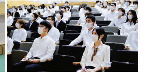
2022年度留学生入学宣誓式 (2022年7月8日挙行)